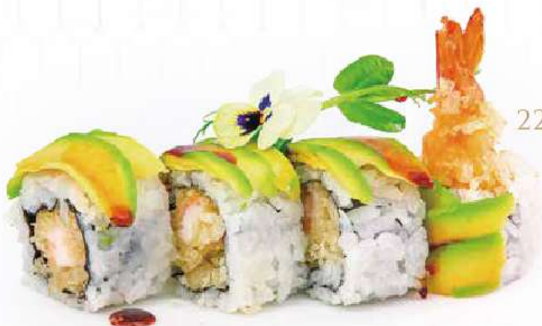
220 GREEN DRAGON 8PZ gambero* in tempura, maionese, avocado all'esterno, salsa teriyaki €12.00 ①②③④