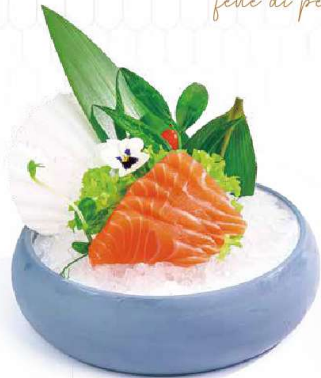
160 SASHIMI SAKE 10PZ sashimi di salmone €10.00 🍣