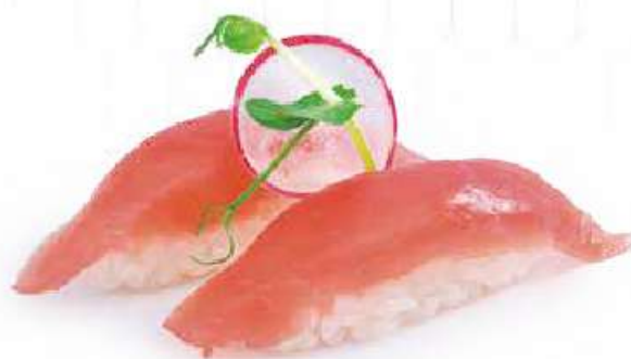
95 | NIGIRI MAGURO tonno €3.50 🌱