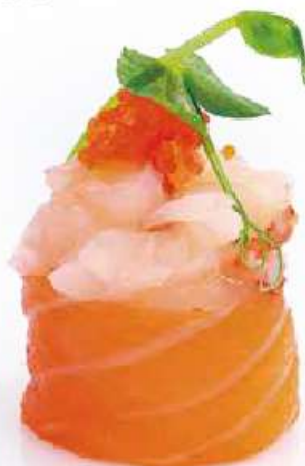
131 | GUNKAN INARI 2PZ tartare di gambero crudo*, e tobiko*, avvolte con il salmone all'esterno €5.00 🌱🌱🌱