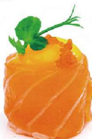
129 | GUNKAN SPHERE 2PZ uova di quaglia e tobiko, avvolte con il salmone all'esterno €6.00 🌱🌱