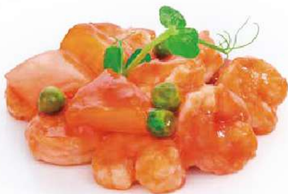
292 | GAMBERI* IN SALSA AGRODOLCE €8.00 ① ②