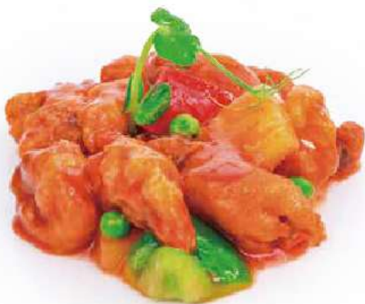
303 | POLLO IN SALSA AGRODOLCE €8.00 🌱