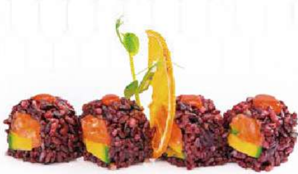
235 | HOT NIGHT 8PZ riso venere, tartare di salmone piccante, avocado, tobiko*, salsa sriracha €12.00 🌱🌱