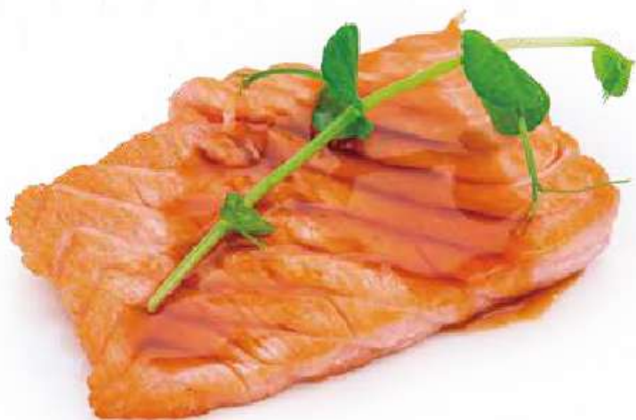
317 | SAKE TEPPANYAKI 2PZ filetto di salmone alla piastra con salsa teriyaki €8.00 ① ② ③