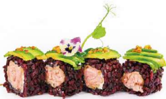
237 | PISTACCHIO ROLL 8PZ salmone fritto e philadelphia, ricoperto da avocado e granelli di pistacchio €12.00 🌱🌱🌱🌱