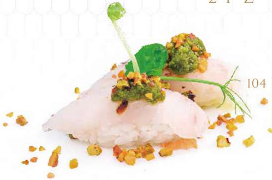
104 | SUZUKI NUT branzino, granella di pistacchio, con salsa al pesto €3.50 🌱🌱