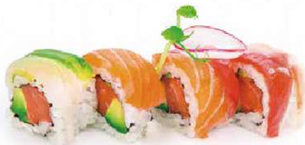
212 | RAINBOW ROLL 8PZ salmone, avocado, carpaccio di pesce misto e avocado all'esterno €12.00 (V) (G) (L) (D)