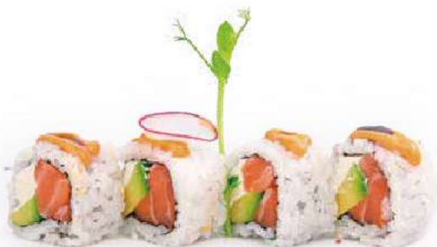
215 | VULCANO ROLL 8PZ salmone, avocado, philadelphia, salsa teriyaki, salsa maionese €10.00 (V) (G) (L) (D)