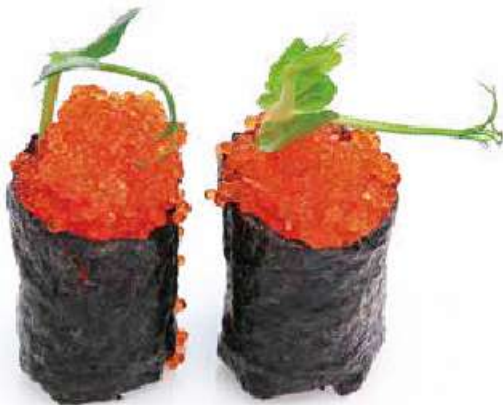
114 | GUNKAN TOBIKO uova di pesce volante*, avvolto con le alghe nori all'esterno €5.00 🍷