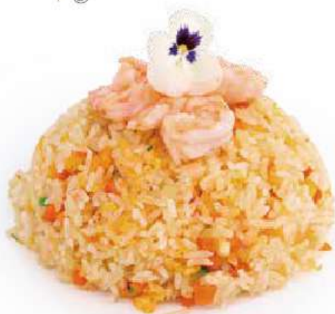
252 | EBI MESHI riso saltato con gamberi*, uova e verdure €7.00 🌱🌱