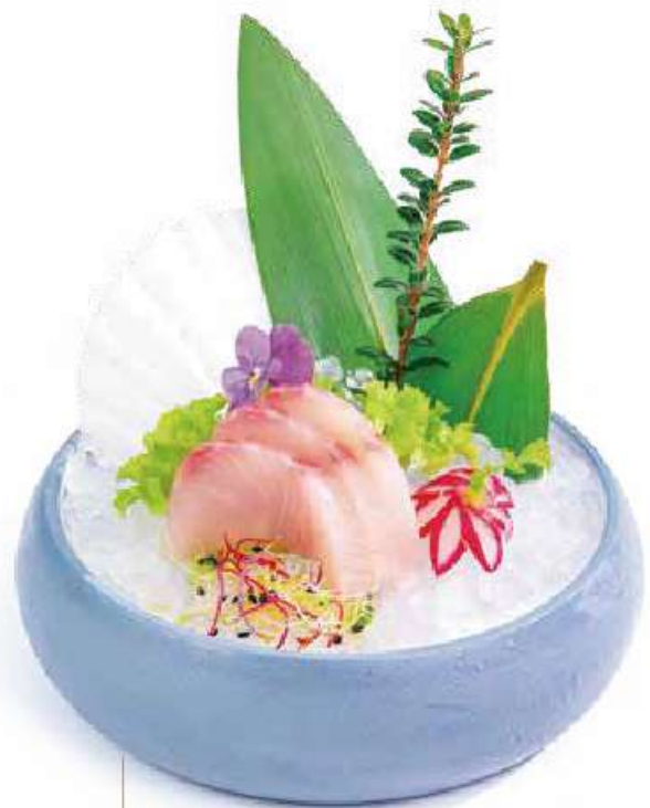
163 SASHIMI RICCIOLA* 5PZ €7.00 🍣