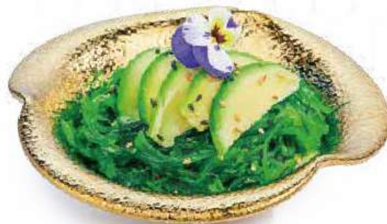
37 | GOMA AVOCADO 🍣 🌱 insalata di alghe*leggermente, piccante, avocado €5.00 🌱