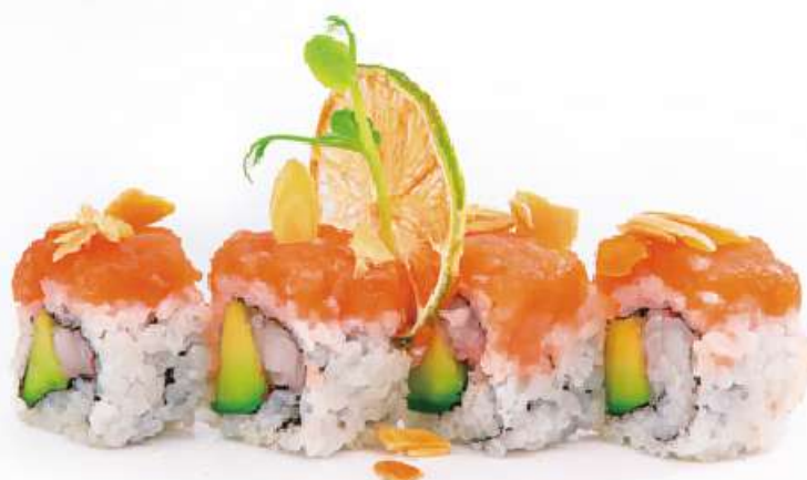
221 HACHIKO MAKI 8PZ gambero crudo*, avocado, tartare di salmone e scaglie di mandorle all'esterno, salsa teriyaki €12.00 ①②③④