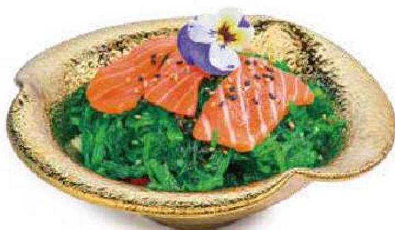
38 | GOMA SAKE 🍣 insalata di alghe*leggermente, piccante con salmone €5.00 🌱 🍣