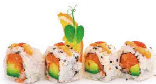
208 | URAMAKI SPICY SAKE 8PZ 🍴 tartare di salmone piccante, tobiko*, avocado, salsa maionese piccante €9.00 🍴🍴🍴