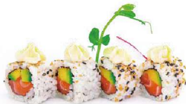
207 | URAMAKI PHILADELPHIA 8PZ salmone, avocado, philadelphia €9.00 🍴🍴🍴