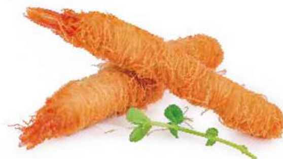
50 | EBI NIDO 4PZ gamberi* avvolti in pasta kataifi €12.00 🍷🍴