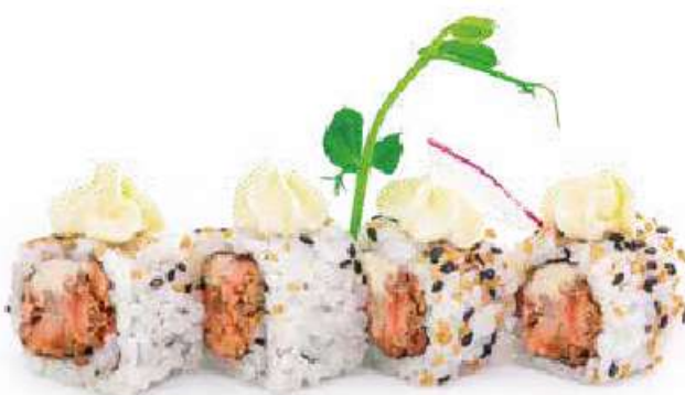
209 | URAMAKI MIURA 8PZ salmone grigliato condito con philadelphia, salsa teriyaki, pasta tempura €8.00 🍴🍴🍴🍴