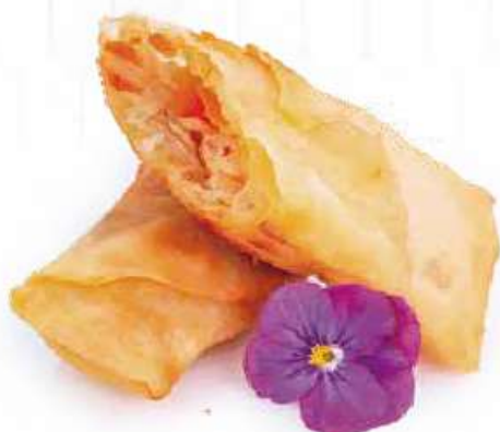
45 | EBI HARUMAKI 2PZ involtino giapponese con gamberi* e verdure €5.00 🍷🍴