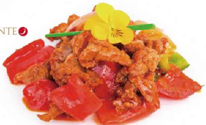
294 | MANZO IN SALSA PICCANTE ① manzo saltato con peperone e salsa piccante €8.00 ①