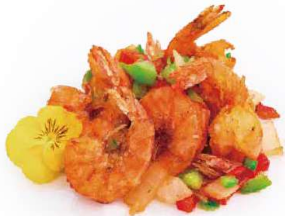
288 | GAMBERI SALE E PEPE gamberi saltati con sale e pepe, peperoni, cipolle €8.00 🍴