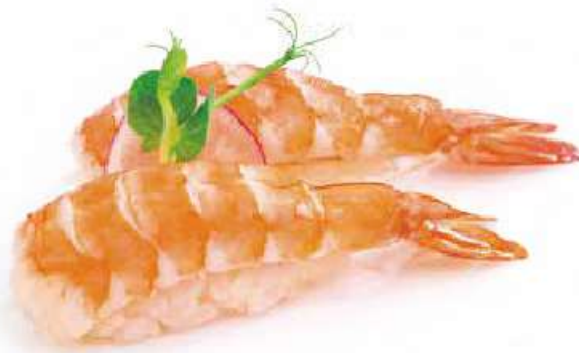
97 | NIGIRI EBI gambero cotto €3.50 🌱