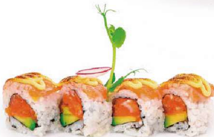
222 PHOENIX ROLL 8PZ tartare di salmone piccante, avocado, tobiko*, carpaccio di salmone scottato all'esterno, salsa inari €12.00 ①②③④