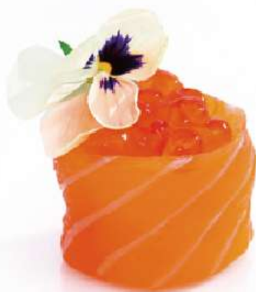
130 | GUNKAN IKURA 2PZ uova di salmone*, avvolte con il salmone all'esterno €5.50 🌱