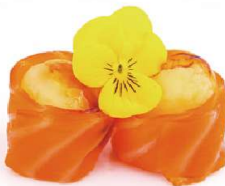
41 | SAKE IMO YAKI 4PZ salmone arrotolato con pure di patate e salsa teriyaki €7.00 🌱 🍣