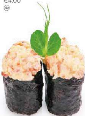
112 | GUNKAN EBI tartare di gambero cotto*, tobiko*, maionese, avvolto con le alghe nori all'esterno €4.00 🍷🍴