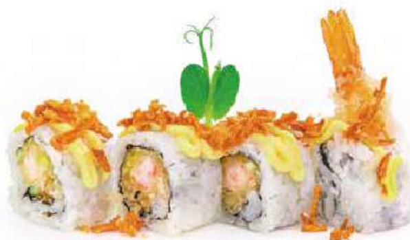
216 | CRISPY EBI ROLL 8PZ gambero* fritto, granella di cipolla fritto, salsa cheese e salsa teriyaki €9.00 (V) (G) (L) (D)