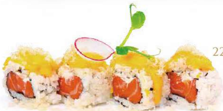
225 | MANGO MADNESS 8PZ tartare di salmone, philadelphia, mango e pasta tempura all'esterno, salsa al mango €12.00 🌱🌱🌱🌱