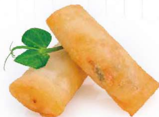
46 | INVOLTINI PRIMAVERA 4PZ 🍴 croccante sfoglia di grano con ripieno di verdure €3.50 🍷