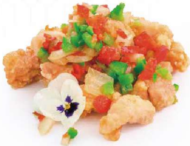
300 | POLLO AL SALE E PEPE pollo fritto con sale e pepe €8.00 🌱