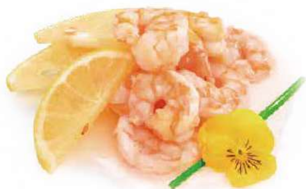
290 | GAMBERI* IN SALSA AL LIMONE €8.00 🍴🍷