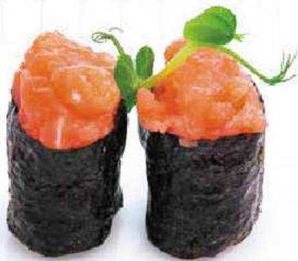
110 | GUNKAN SAKE tartare di salmone avvolto con le alghe nori all'esterno €4.00 🍷