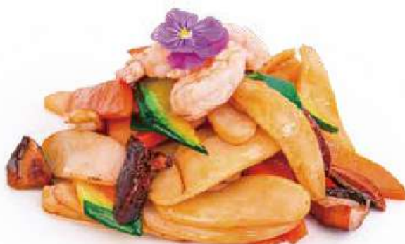
255 | EBI GNOCCHI gnocchi saltati con verdure e funghi, gamberi €8.00 🌱🌱