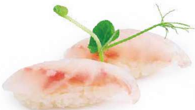
96 | NIGIRI SUZUKI branzino €3.00 🌱