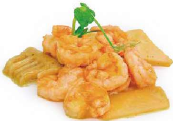
287 | GAMBERI AL CURRY gamberi saltati con bambu e salsa curry €8.00 🍴🍷