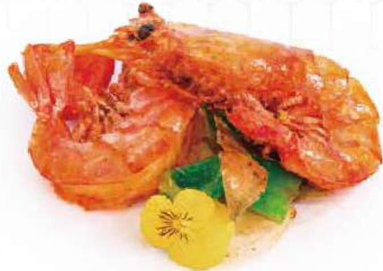
286 | GAMBERONI IN SALE E PEPE 4PZ €10.00 🍴