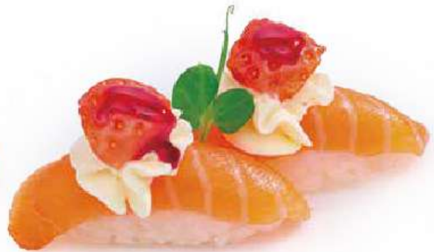
106 | SAKE ICHIGO salmone con fragola, e salsa al frutti di bosco, philadelphia €3.50 🌱🌱