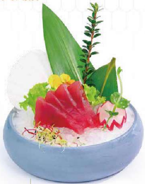
161 SASHIMI MAGURO 8PZ Sashimi di tonno €12.00 🍣