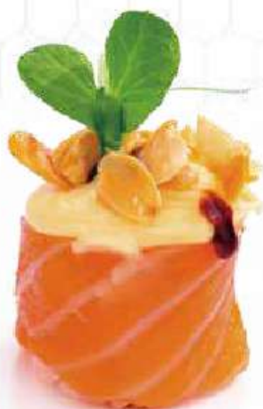
126 | GUNKAN DIAMOND 2PZ mandorle scaglie, sopra la salsa inari, avvolte con il salmone all'esterno €5.00 🌱🌱🌱🌱🌱