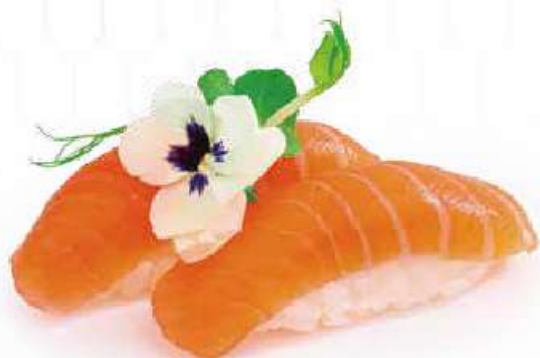
94 | NIGIRI SAKE salmone €3.00 🌱