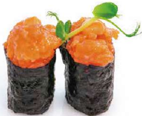
113 | GUNKAN SPICY SAKE 🌶️ tartare di salmone piccante, tobiko*, avvolto con le alghe nori all'esterno €4.50 🍷🍴