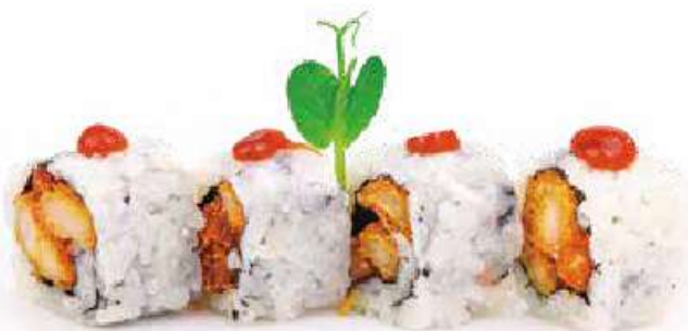
213 | URAMAKI CHICKEN 8PZ pollo fritto, maionese, salsa barbecue €9.00 (V) (G) (L) (D)