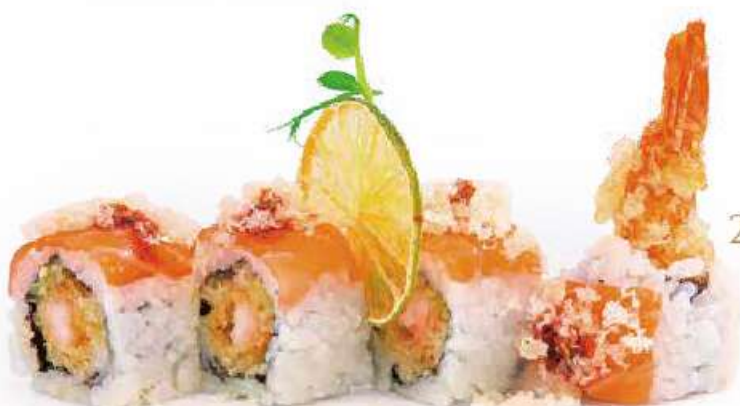
227 | TIGER ROLL 8PZ gambero* in tempura al maionese, carpaccio di salmone all'esterno, pasta tempura, salsa teriyaki €12.00 🌱🌱🌱🌱