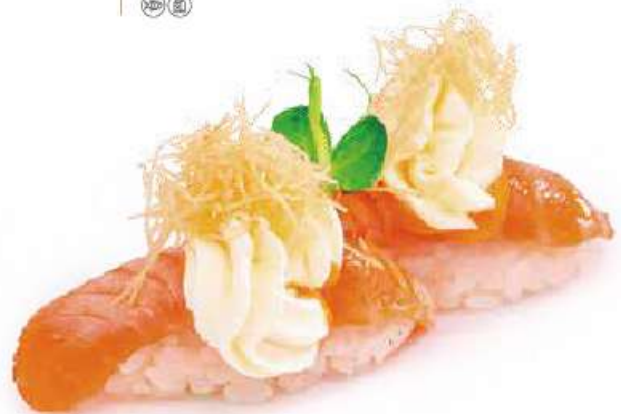
108 | SAKE FLAMBÉ HONEY salmone scottato, con philadelphia, pasta kataifi e salsa al miele €4.00 🌱🌱🌱