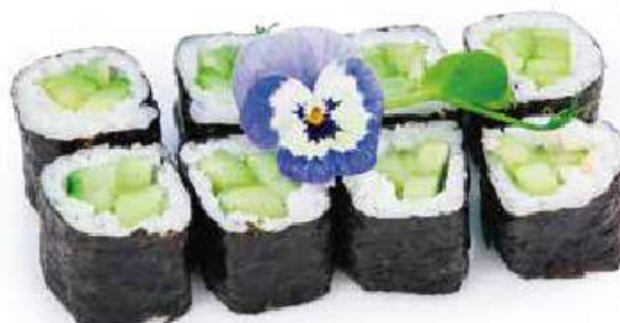
189 | HOSO KAPPA 🌱 cetriolo €4.50