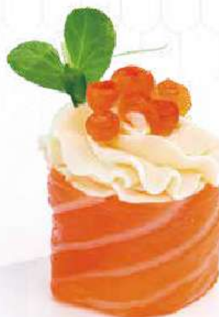
127 | GUNKAN PHILA IKURA 2PZ uova di salmone*, philadelphia, avvolte con il salmone all'esterno €5.50 🌱🌱