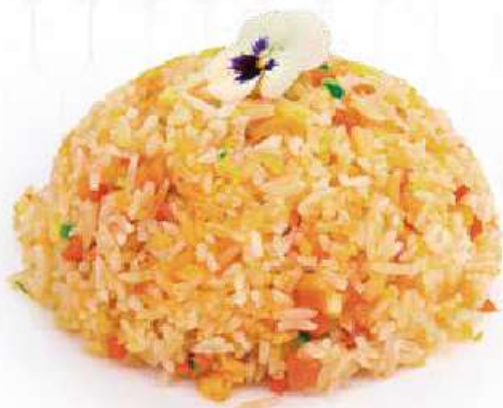
250 | YASAI MESHI 🌱 riso saltato con uova e verdure €6.00 🌱