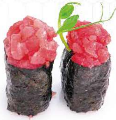
111 | GUNKAN MAGURO tartare di tonno, avvolto con le alghe nori all'esterno €4.50 🍷