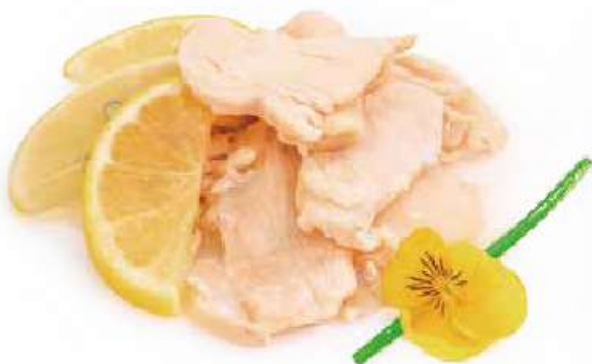
301 | POLLO AL LIMONE €8.00 🌱