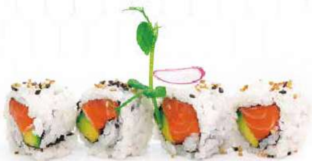
205 | URAMAKI SAKE 8PZ salmone, avocado €8.00 🍴🍴