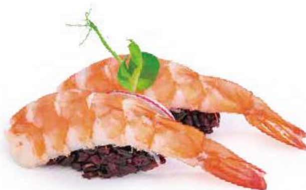
99 | BLACK EBI riso venere, gambero cotto €3.50 🌱