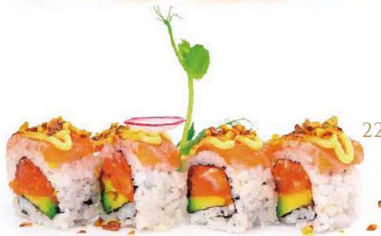
226 | BRIGHT STAR 8PZ tartare di salmone piccante, avocado, tobiko*, carpaccio di salmone scottato e granella di pistacchio all'esterno, salsa inari €12.00 🌱🌱🌱🌱