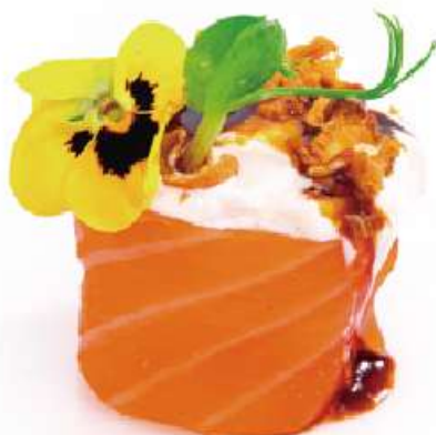
128 | GUNKAN BURRATA 2PZ burrata e cipolla fritto avvolte con il salmone all'esterno con salsa teriyaki €5.00 🌱🌱🌱