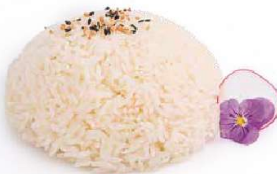
253 | WHITE MESHI 🌱 riso bianco al vapore con sesamo €3.00 🌱