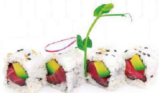
206 | URAMAKI MAGURO 8PZ tonno, avocado €9.00 🍴🍴