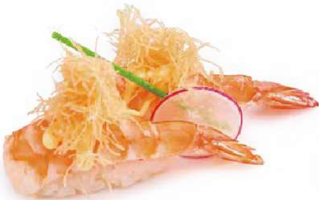
107 | EBI LIGHT gambero cotto*, con la pasta kataifi, con salsa zafferano €4.00 🌱🌱🌱