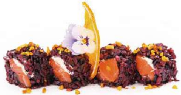
238 | NISHINO MAKI 8PZ riso venere, salmone, philadelphia, granella di pistacchio all'esterno, salsa teriyaki €12.00 🌱🌱🌱🌱🌱