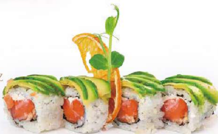
223 CATERPILLAR ROLL 8PZ salmone, pasta tempura, philadelphia, avocado all'esterno, salsa teriyaki €11.00 ①②③④