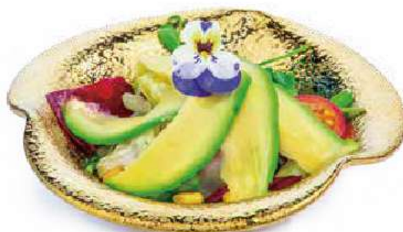
39 | AVOCADO SALAD 🌱 insalata mista, avocado, salsa sesamo €6.00 🌱 🌱 🌱