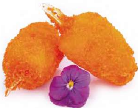
49 | CHELE DI GRANCHIO* 4PZ polpa di granchio fritta €5.00 🍷🍴