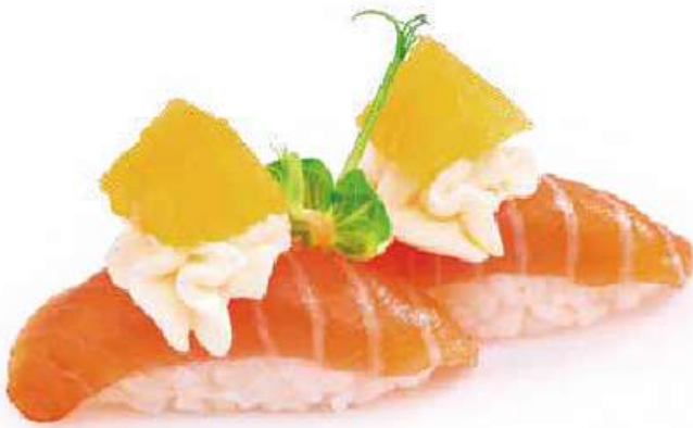
105 | SAKE ORANGE salmone alla arancia e philadelphia €3.50 🌱🌱