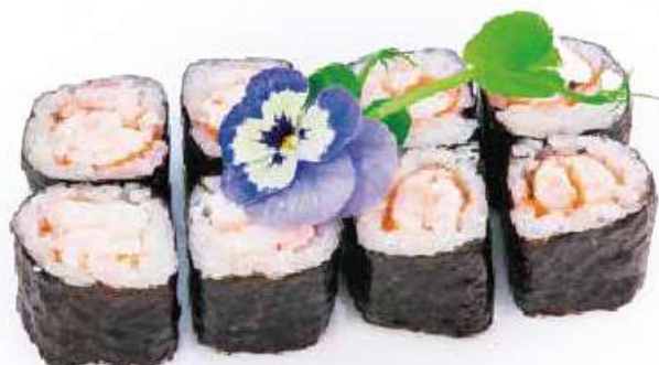
187 | HOSO EBI gambero cotto* €5.00 🌱