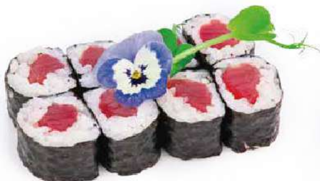
186 | HOSO MAGURO tonno €6.00 🌱