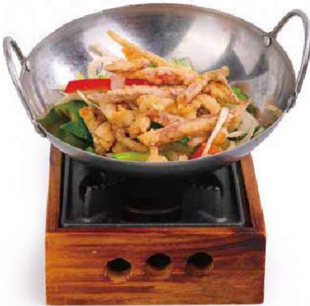
325 ONABE IKA 🍣 ciuffi di calamari fritti saltate con fornello €15.00 🍴🌱🌶️