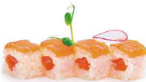
210 | SALMONE ROLL 8PZ salmone, philadelphia con salmone all'esterno €12.00 🍴🍴