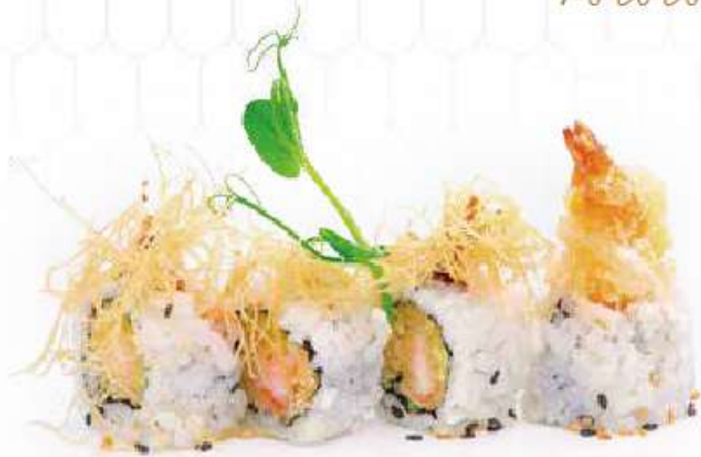
211 | URAMAKI EBITEN 8PZ gambero* in tempura, maionese, pasta kataifi, salsa teriyaki €9.00 (V) (G) (L) (D)