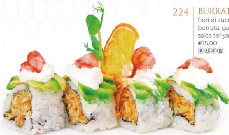
224 | BURRATA ROLL 8PZ fiori di zucca fritta, con avocado, burrata, gamberi rossi all'esterno, salsa teriyaki €15.00 🌱🌱🌱🌱