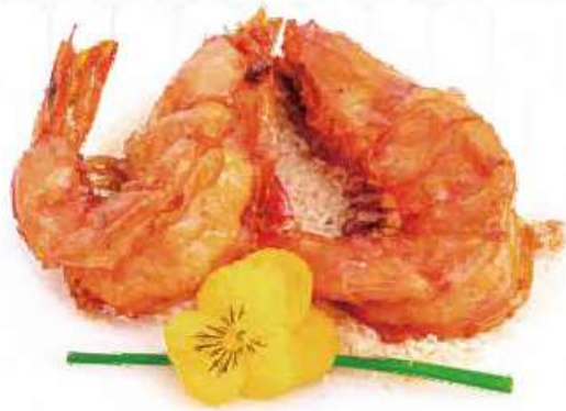
285 | OSAKA 4PZ gamberoni* croccanti con panko e aglio €10.00 🍴🍷