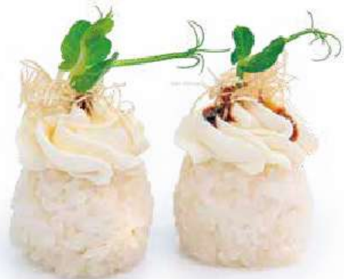
115 | GUNKAN WHITE 🍷 pallina di riso bianco con philadelphia, e la salsa teriyaki €3.00 🍷🍴