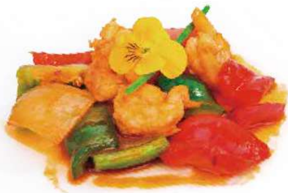
289 | GAMBERI* IN SALSA 🌶️ PICCANTE €8.00 🍴🍷