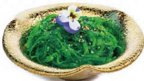
36 | GOMA WAKAME 🍣 🌱 insalata di alghe* leggermente piccanti €4.00 🌱