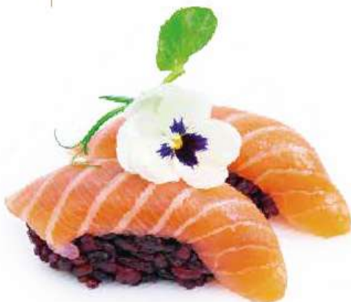
98 | BLACK SAKE riso venere, salmone €3.00 🌱