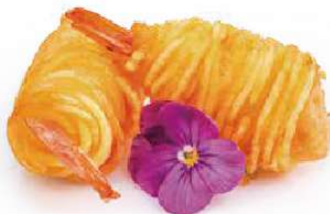
48 | EBI FURAI 4PZ gamberi* avvolti in pasta di patate €6.00 🍷🍴