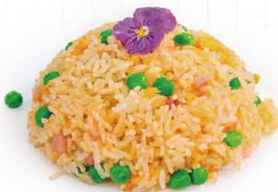
251 | RISO CANTONESE riso saltato con prosciutto, uova e piselli €7.00 🌱🌱