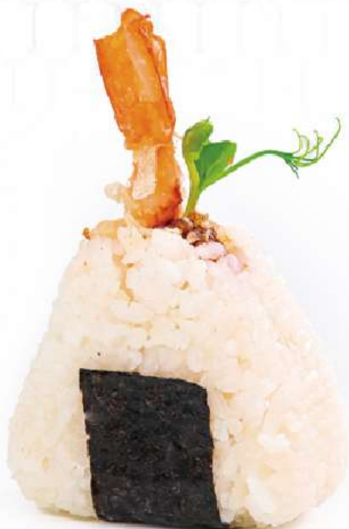
245 | ONIGIRI EBITEN polpette di riso con gamberi fritti, maionese, salsa teriyaki €4.00 🌱🍱🌶️