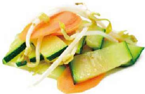
304 | YASAI ITAME 🌱 verdure miste saltate €5.00 🌱