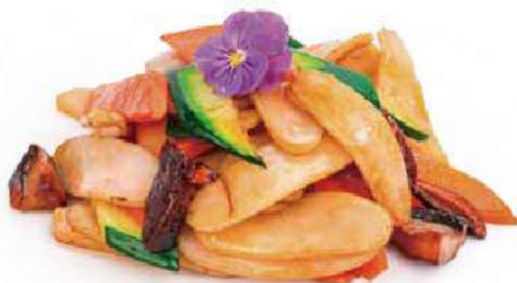
254 | YASAI GNOCCHI 🌱 gnocchi saltati con verdure e funghi €6.00 🌱