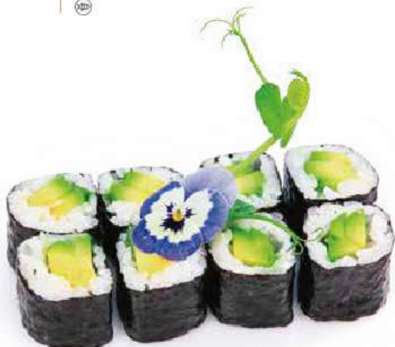
188 | HOSO AVOCADO 🌱 avocado €4.50