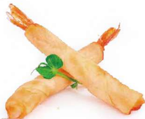
47 | SAMURAI STICK 4PZ involtini di gamberi* €6.00 🍷🍴