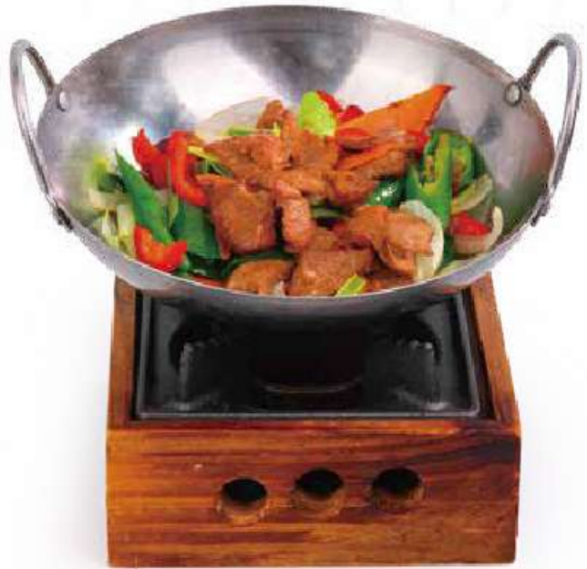
326 ONABE MANZO 🍣 manzo e verdure saltate con fornello €12.00 🍴