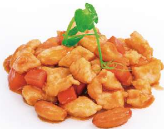
302 | POLLO ALLE MANDORLE €8.00 🌱