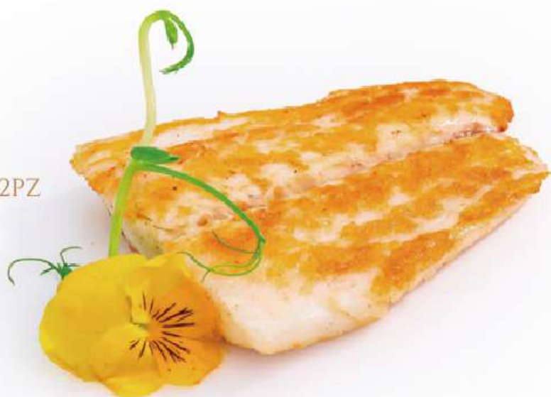
318 | SUZUKI TEPPANYAKI 2PZ filetto di branzino alla piastra con salsa teriyaki €9.00 ① ② ③