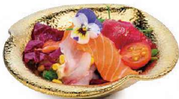
40 | SASHIMI SALAD insalata mista con pesce crudo, salsa sesamo €9.00 🌱 🍣 🍣 🍣