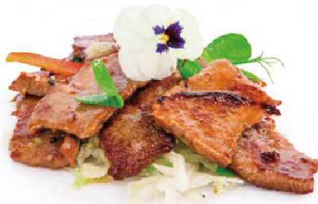
293 | MANZO YAKINIKU manzo saltato con salsa yakiniku, insalata €9.00 ①