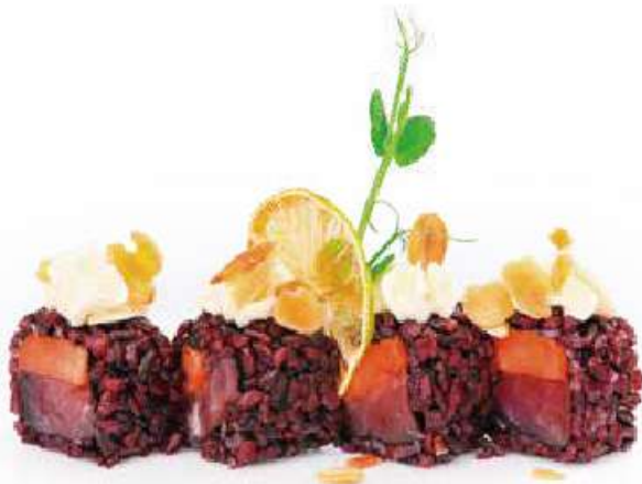
239 | KOKKORO VENUS 8PZ riso venere, tonno, ricoperto con philadelphia, papaya, mandorle €12.00 🌱🌱🌱