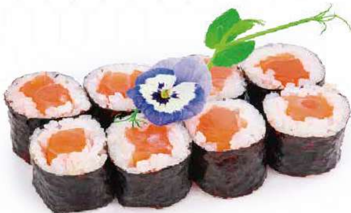
185 | HOSO SAKE salmone €5.00 🌱