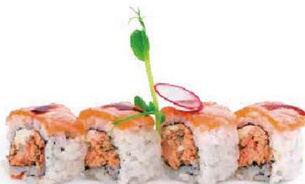
214 | SUNRISE ROLL 8PZ salmone grigliato condito con philadelphia, carpaccio di salmone scottato all'esterno, salsa teriyaki €12.00 (V) (G) (L) (D)