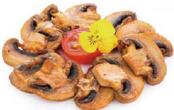
319 | YAKI KINOKO ② funghi alla piastra €7.00