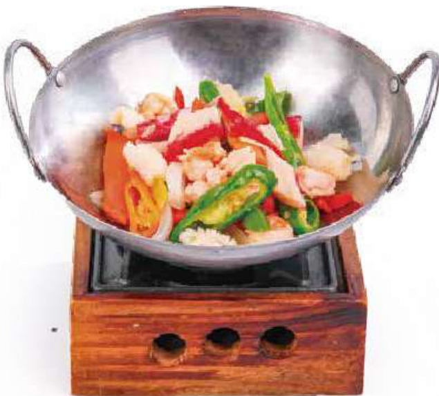
327 ONABE FRUTTI DI MARE 🍣 gamberi*, frutti di mare* e verdure saltate con fornello €15.00 🍴🌱🌶️