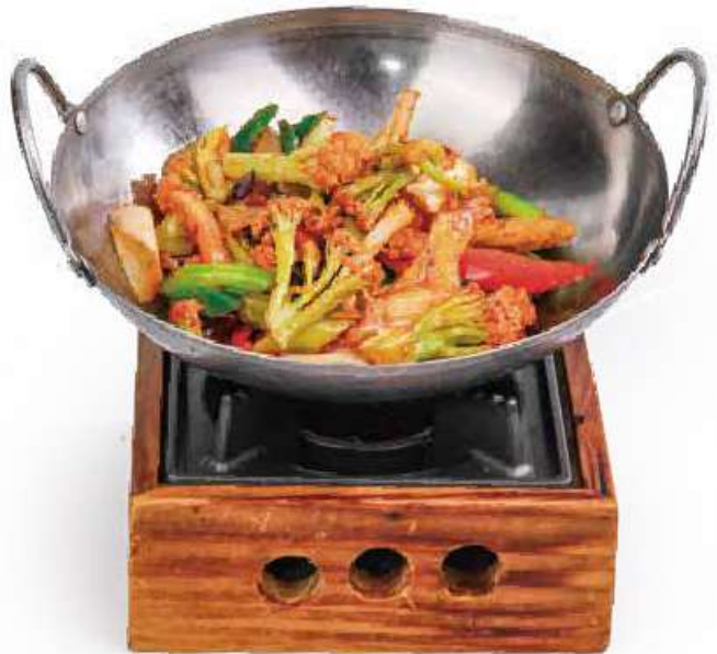
328 ONABE CAVOLOFIORI 🍣🌱 cavolfiore cinese saltato con fornello €12.00 🍴