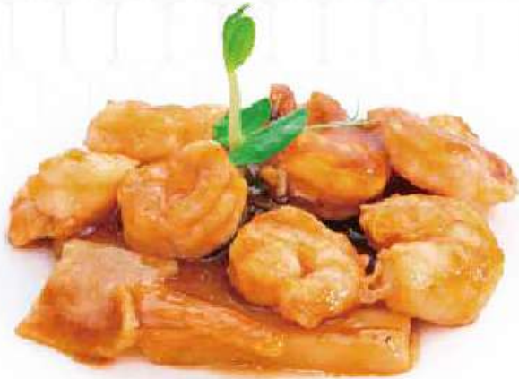
291 | GAMBERI* CON FUNGHI E BAMBÙ €8.00 ① ②