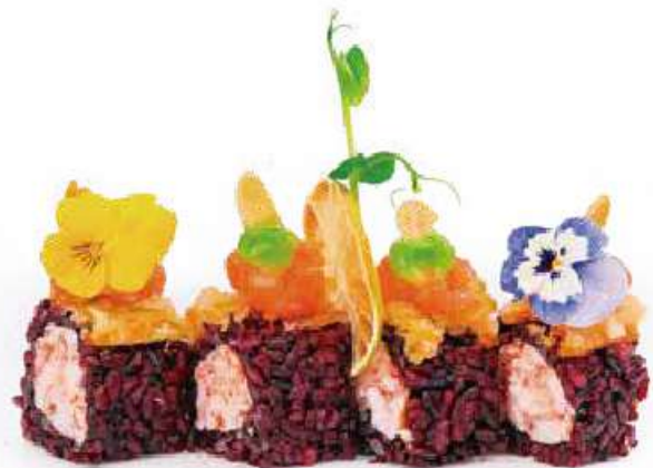
240 | INARI MAKI 8PZ riso venere avvolto con gamberi cotti, ricoperto con fiori di zucca fritto, tartare di salmone, scaglie di mandorle, e salsa avocado €15.00 🌱🌱🌱🌱🌱