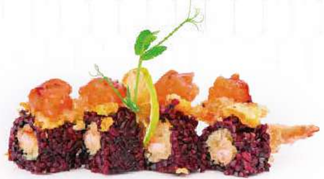
236 | EBI FLO 8PZ riso venere, gambero* in tempura, philadelphia, tartare di salmone, fiori di zucca e salsa teriyaki €12.00 🌱🌱🌱🌱🌱