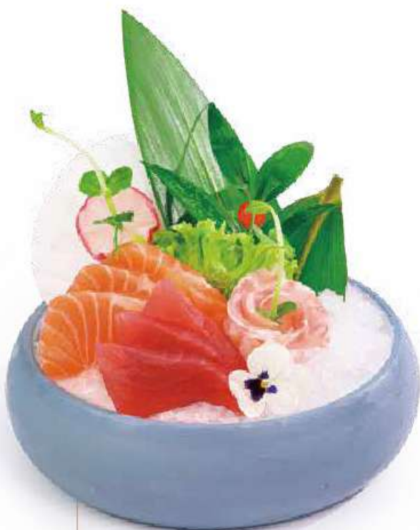
162 SASHIMI MIX 8PZ sashimi misto €12.00 🍣